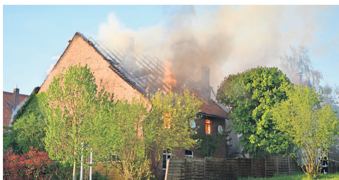
Das alte Gebäude, hier der angebaute Werkstattbereich, brannte bis auf die Grundmauern nieder.

Über die Höhe des entstandenen Sachschadens liegen noch keine genauen Erkenntnisse vor. Während des Feuerwehreinsetzes war die Landesstraße L 588 Halle – Harderode für den Fahrzeugverkehr voll gesperrt.