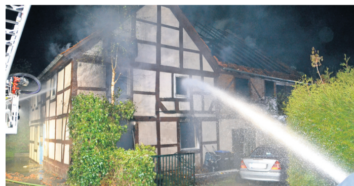
Die Feuerwehr ging mit einem massiven Löschwasserangriff gegen den Brand vor.