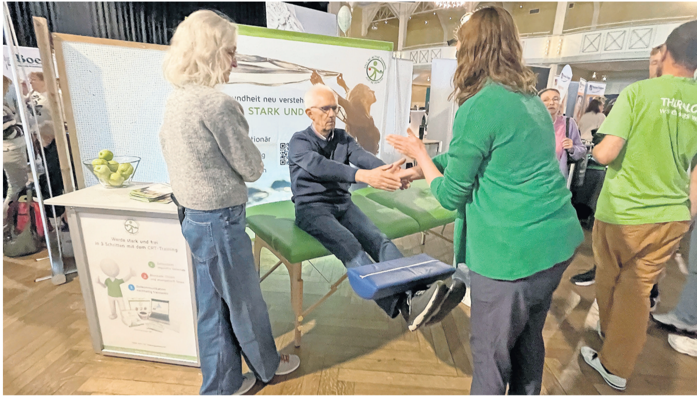
An den Ständen konnte auch viel ausprobiert werden.

Direkt daneben informierte das Team von der Nordik-Care Seniorenresidenz über Pflegeangebote und freie Kapazitäten. Kleine Tütchen mit Gummibärchen dienten dabei als Aufmerksamkeit für die Besucher – ein Detail, das nicht ganz